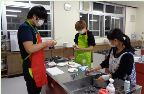
授業風景（調理実習）